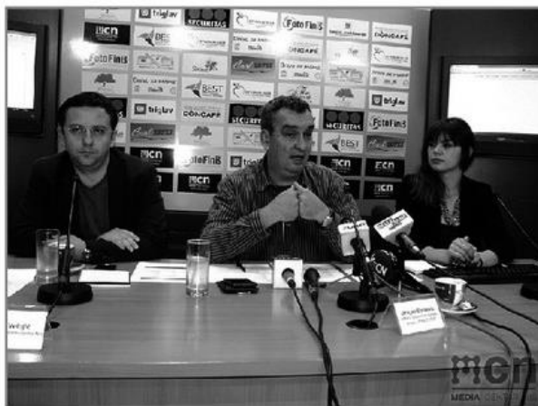
ПОДРШКА ЉУДИМА ДА БУДУ ОНО ШТО ЈЕСУ: конференција подршке невладиног сектора

"Циљ је да се покаже да је то проблем свих нас јер се не води рачуна о владавини права. На овај начин